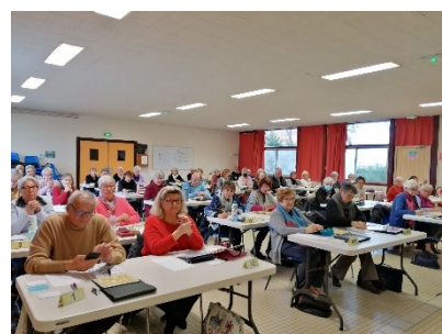
45 joueurs dans la salle du Prieuré